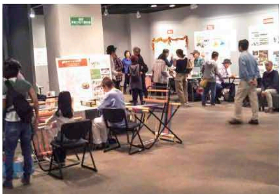
▲ 展示とミニ体験で活動をアピール