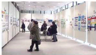
▲ NPO ウィーク 2017 展示の様子