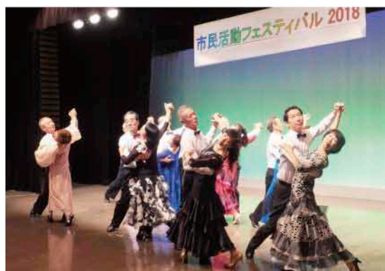
▲ 活動の成果を存分に発揮

社交ダンスを披露したみなさんは、発表を終えて会場から拍手が沸き起こると、ぴしっとした姿勢と緊張した面持ちから、ふっと力が抜けて満面の笑みに。