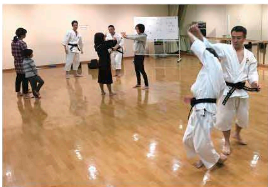
▲ 体験してもらうことで活動をより深く知ってもらう