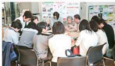
▲ NPO ウィーク 2018 日替わりワークショップの様子